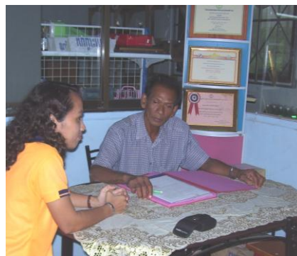
ภาพที่ 2 ผู้ขายทำสัญญาซื้อขายกับสำนักงานตลาดกลางยางพารา นครศรีธรรมราช