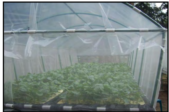
ภาพผนวกที่ ๓ กิจกรรมการดำเนินงาน ณ โรงเรียนพิทักษ์วิทยาคม อ.อ. อำเภोजะเเนะ จังหวัดนราธิวาส