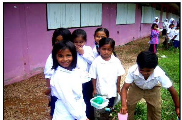
ภาพผนวกที่ ๒ กิจกรรมการดำเนินงาน ณ โรงเรียนบ้านไอร์โซ อำเภोजะเณระ จังหวัดนราธิวาส