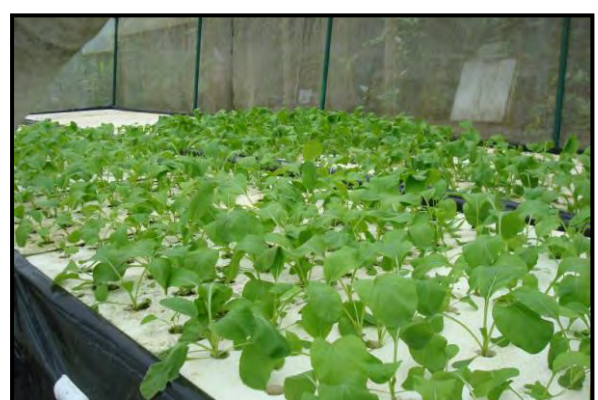
ภาพผนวกที่ ๔ กิจกรรมการดำเนินงาน ณ โรงเรียนจรรยาอิสลามวิทยา อำเภอตากใบ จังหวัดนราธิวาส