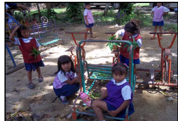
ภาพผนวกที่ ๕ กิจกรรมการดำเนินงาน ณ โรงเรียน ตชด. บ้านไอร์ป้อแต อำเภोजะแนะ จังหวัดนราธิวาส