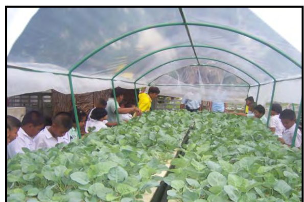
ภาพผนวกที่ ๑ กิจกรรมการดำเนินงาน ณ โรงเรียนวัดพระพุท อําเภอตากใบ จังหวัดนราธิวาส