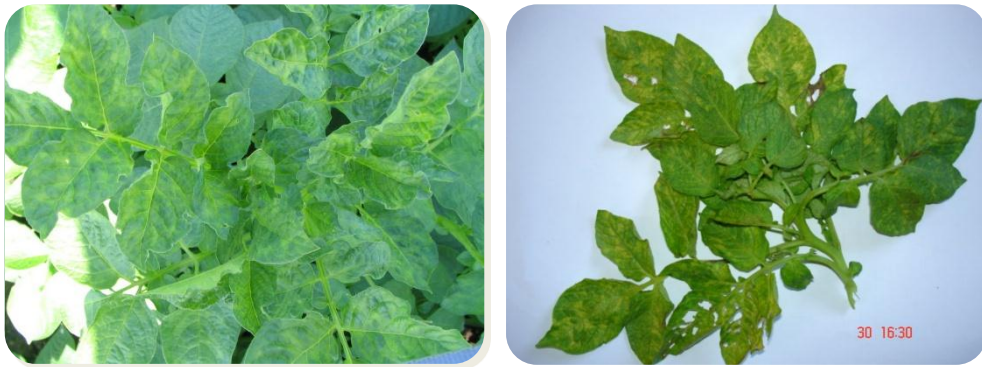
ภาพที่ 1 ลักษณะอาการต่างของเชื้อไวรัสบนใบมันฝรั่ง

2554 ได้ตัวอย่างทั้งหมด 700 ตัวอย่าง ในปี 2555 ได้สำรวจและเก็บตัวอย่างใบมันฝรั่งในพื้นที่ อ.ไชยปราการ อ.แม่ฮาด อ.ฝาง อ.สันทราย จ.เชียงใหม่ และ อ.พบพระ จ.ตาก ได้ตัวอย่างทั้งหมด 700 ตัวอย่าง และในปี 2556 ได้สำรวจและเก็บตัวอย่างอาการใบต่างของมันฝรั่งจากแปลงปลูกของเกษตรกรใน อ.แม่ฮาด อ.ฝาง อ.ไชยปราการ อ.สันทราย จ.เชียงใหม่ อ.แจ้ห่ม จ.ลำปาง อ.แม่สอด อ.พบพระ จ.ตาก ได้ตัวอย่างทั้งหมด 630 ตัวอย่าง ซึ่งการสำรวจและจำแนกต้องทำการรวบรวมข้อมูลแหล่งปลูกมันฝรั่งก่อนเป็นขั้นตอนแรก ก่อนทำการออกสำรวจและเก็บรวบรวมตัวอย่างมันฝรั่งในแต่ละแหล่งปลูกของเกษตรกรเพื่อนำตัวอย่างมันฝรั่งนั้นกลับมาตรวจในห้องปฏิบัติการ เพื่อใช้เป็นข้อมูลของเชื้อ PVA PVM PVT PVX PVS และ PLRV ที่ตรวจพบในแต่ละแหล่งปลูก