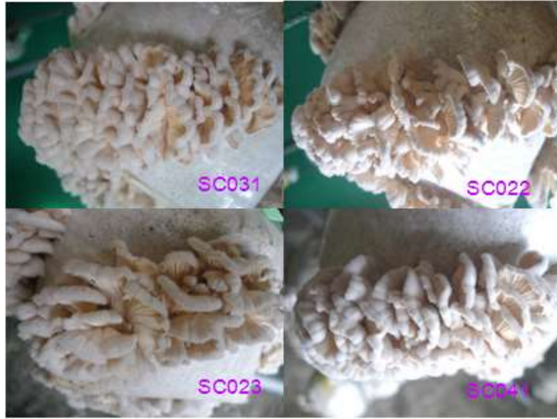
ภาพที่ 3 ลักษณะเห็นแครงแต่ละสายพันธุ์