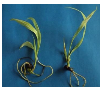
ภาพที่ 1 การเกิดรากของต้นอ่อนปาล์มน้ำมันบนอาหาร MS ที่เติม paclobutrazol 20 \mu\text{M}