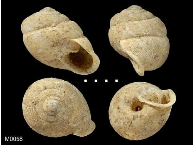
Figure 1 : Shell morphology of Haploptychius sp.