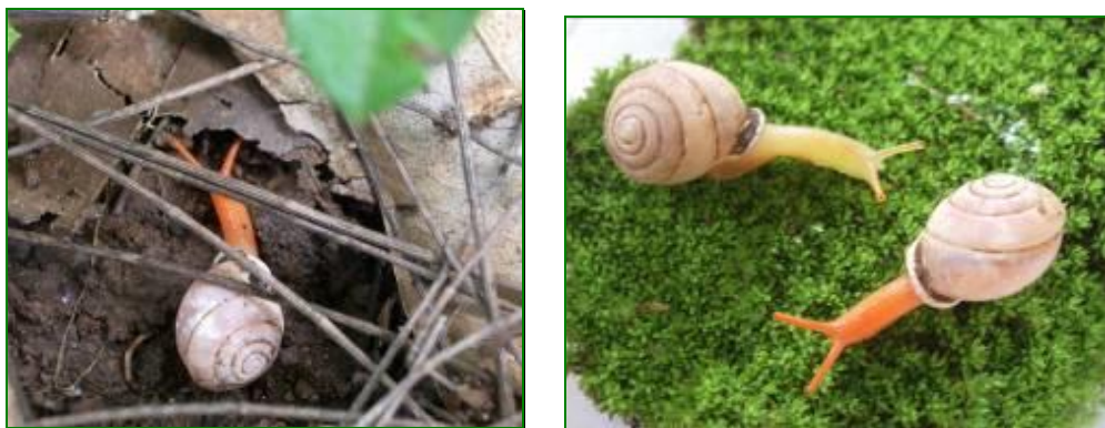
Figure 7 : Living specimens of Perrottetia siamensis (Pfeiffer,1862)