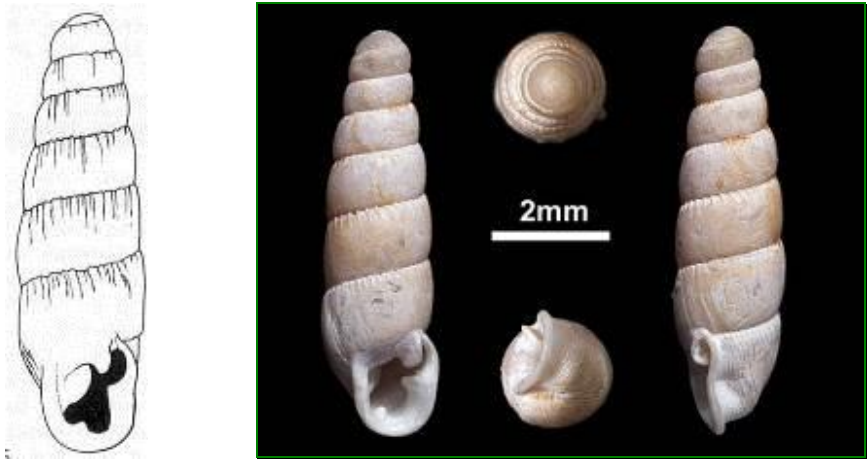
Figure 3 : Shell morphology of G. bicolor (Hutton,1834)