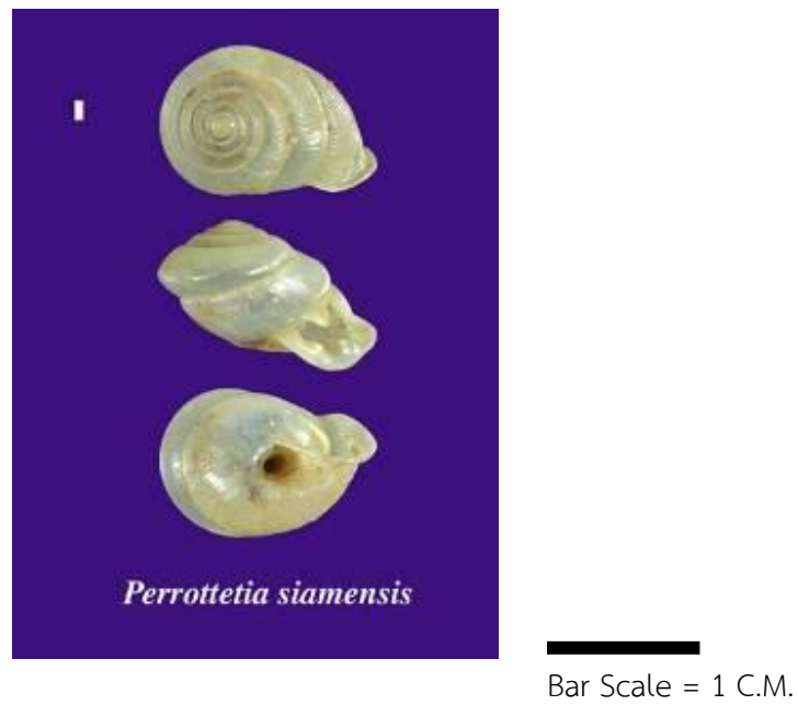
Figure 6 : Shell morphology of Perrottetia siamensis (Pfeiffer,1862)