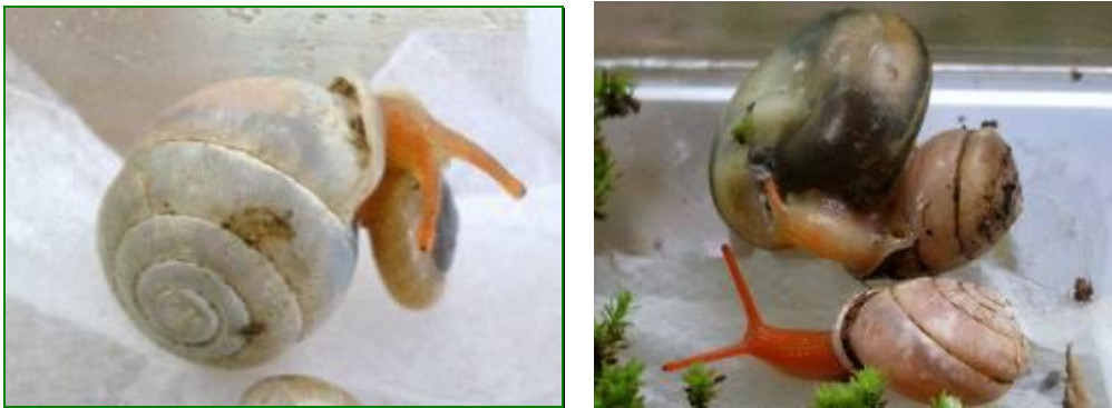
Figure 9 : The predatory snail; Perrottetia siamensis (Pfeiffer,1862) feeding on Cryptozona sp.