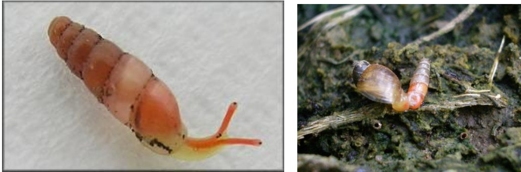
Figure 4 : Living specimen of the two-toned snail; Gulella bicolor (Hutton,1834)