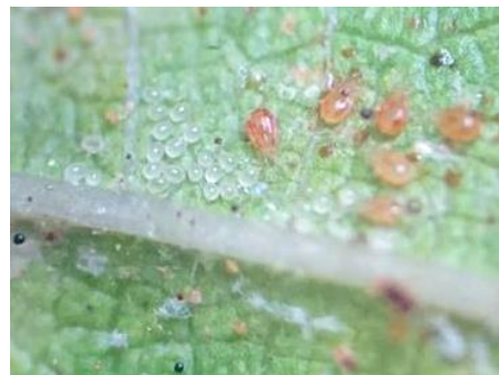
Figure 2 Amblyseius californicus Athias-Henriot