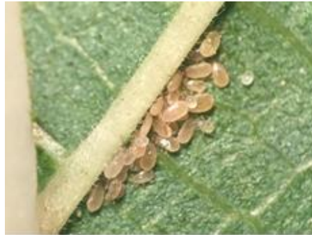
Figure 1 Amblyseius swirskii Athias-Henriot