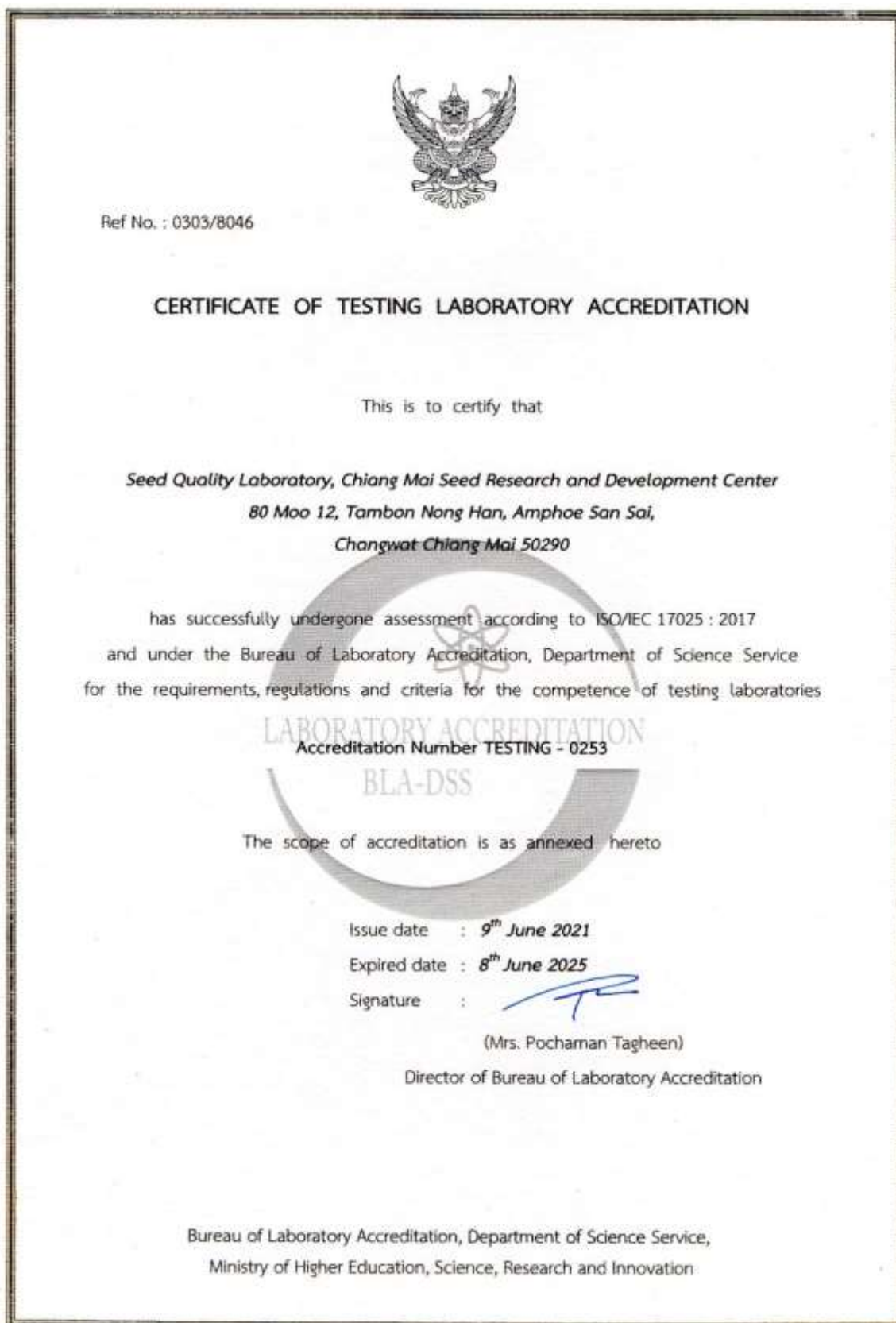
ภาพที่ 2 หนังสือรับรองความสามารถห้องปฏิบัติการทดสอบของห้องปฏิบัติการตรวจสอบคุณภาพเมล็ดพันธุ์ ศูนย์วิจัยและพัฒนาเมล็ดพันธุ์พืชเชียงใหม่